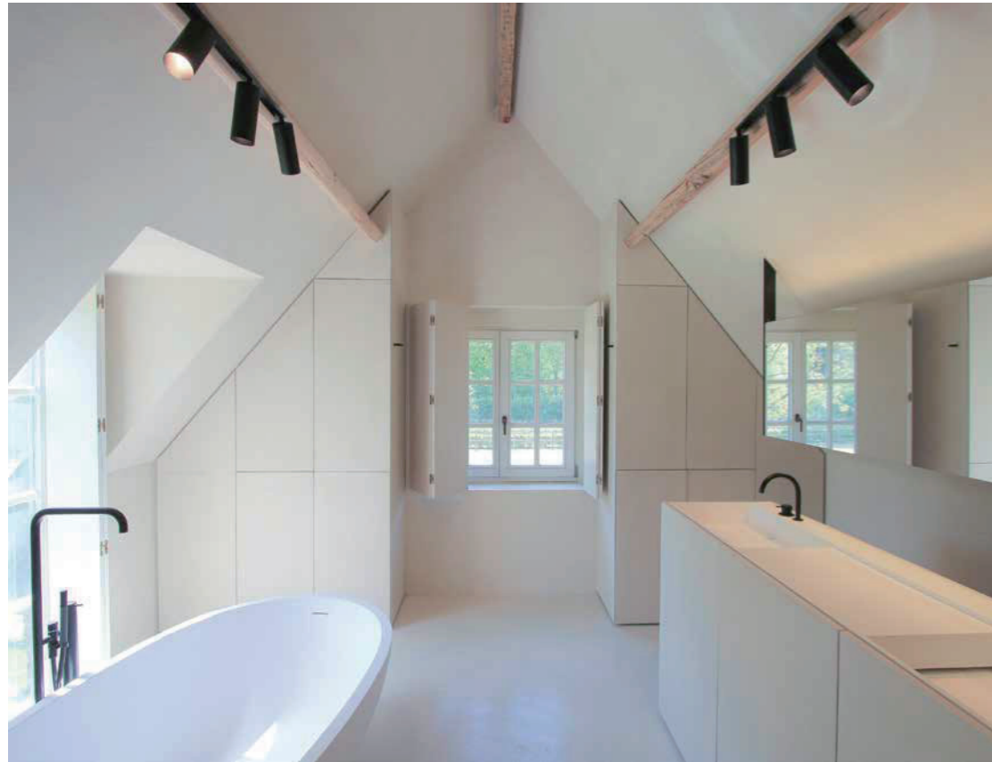
Private loft 2016. Belgium